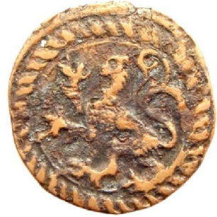
Korte op naam van Karel V ( keerzijde – schaal 200% )

R EFEREREND NAAR MIJN ARTIKEL [1] over ‘enkele opmerkelijke kortes voor Karel V’, waarin ik de studie aanmoedigde m.b.t. vervalsingen en imitaties ervan, werden mij de foto’s linksboven opgestuurd van een korte voor Filips II, met de vraag of ik meer informatie kon verstrekken. De afzender was duidelijk gefascineerd door deze munt, en meer bepaald door de keerzijde met een klimmende leeuw zoals op de kortes van Karel V, geslagen van 1542 tot 1556 [2] ( zie foto rechts ) — de kortes van de eerste emissies van Filips II daarentegen, geslagen (z.j.) van 1556 tot 1567, dragen op de keerzijde vier vuurijzers die rondom een centraal kruis zijn geplaatst [3] . Hij voegde er trouwens foto’s bij ( zie pag. 198 ) van – wat hij noemde – ‘een normale korte (met vuurijzers op de keerzijde)’, gevonden op het Internet [4] , en met een – volgens hem – bijna identiek potret als op de korte met de leeuw.