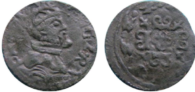
Korte z.j. op naam van Filips II – muntplaats onzeker (onduidelijk muntteken vaag te zien boven het bovenste vuurijzer) (schaal 200%)

geslagen in Brugge); op de plaats waar we een muntteken ♨, ♣ of ★ verwachten, is enkel vaag een onherkenbaar teken (ster?) te zien.