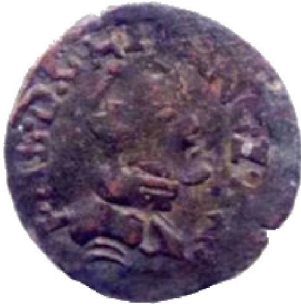
Korte op naam van Filips II – muntplaats onzeker – 1,01 g – Ø 20 mm – ↑↑ ( privécollectie – schaal 200% )